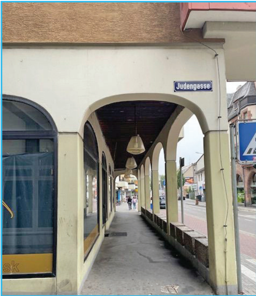
יודען-גאס אין ווירמייזא

דעם טיטל רבינו גרשון מאור הגולה, וואס איז געבליבן אזוי נחירץ אין כלל ישראל, נייטיג צו באמערקן אז רבינו גרשון איז דער מחבר פון די סליחה זכור ברית אברהם.