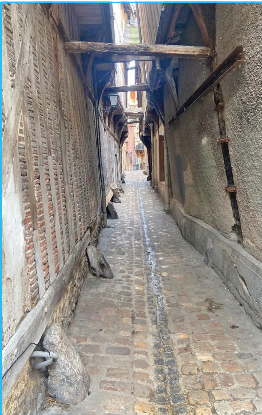
שמאלע געסל אין טרויאש

אייניקל פון רש"י, און געווען אויך א נאנטער תלמיד, אבער דער רבינו תם האט געהאט די גרעסטע ישיבה, אין צאל תלמידים, כאטש ער אליינס איז געווען א תלמיד פון זיין ברודער דער רשב"ם, און דאס איז פארבונדען מיט א מעשה, ווען דער זיידע, רש"י איז נפטר געווארן, האט די מאמע יוכבד זייער געוויינט, דער קליינער יעקב