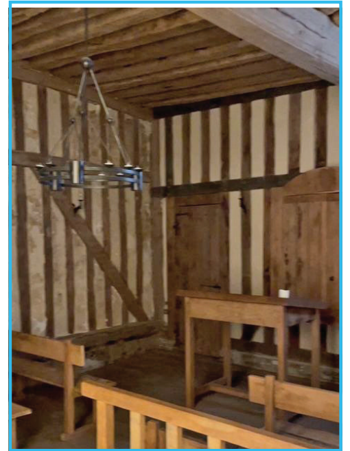
רעפליקע פון רש"י שוהל אין טרויאש

פון דא שפרייזן מיר אריבער קיין ווארמס-ווירמייזא און מיינן-מאגענצע (היינט אין דייטשלאנד, דאן איין מדינה) די געבורט ארט פון יהדת אשכנז, און די