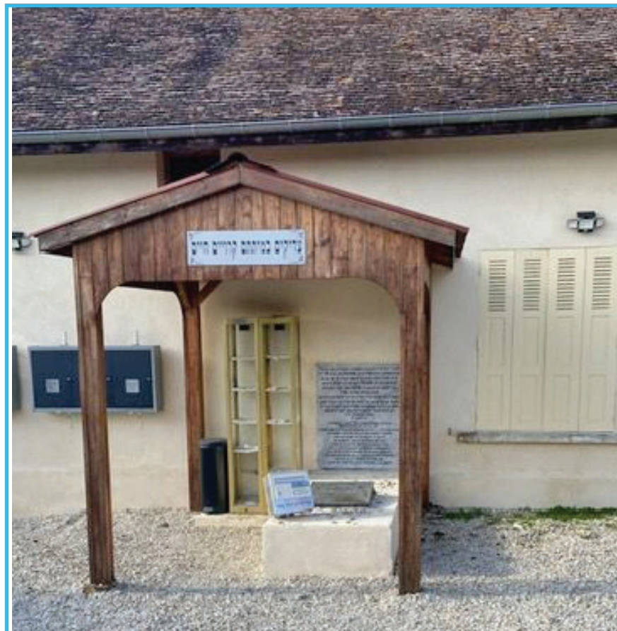
מקום קבורתם פון די בעלי התוספות. רשב"ם - רבינו תם - ריב"ם אין זייער טאטע רבינו מאיר, ועוד ועוד.

בלע"ז, אלס א ראי' צו זיין פשט, וואס דאס איז אלטע ארגינעלע פראנצויזישע ווערטער, (Old French) וואס די היינטיגע פראנצויזישע אקאדעמיקער, פרובירן צו פארשטיין, כדי זיך צו לערנען די אלטע ווערטער שפראך.