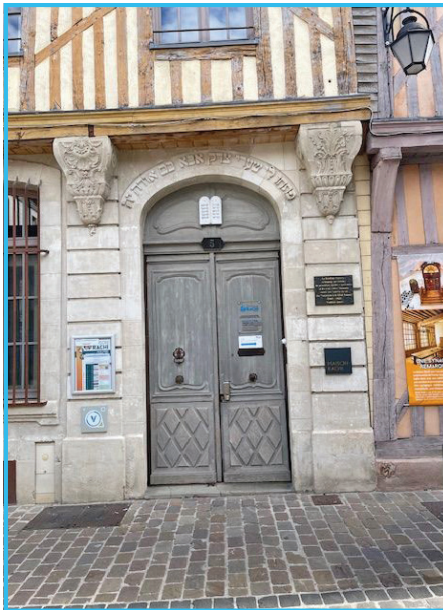
רש"י שוהל אין טרויאש

אנגענומענער הסבר איז ווייל רש"י האט נישט געקענט קיין אראביש, ווידעראום דער אבן עזרא, וואס האט געלעבט 100 יאר נאך רש"י, האט יא געקענט אראביש, און ברענגט אראפ ר' סעדי' גאון מערערע מאל בפרושו, פילע מאל מיטן בשמו, און עטליכע מאל נאר ואמר הגאון וואס מיינט רב סעדי' גאון.